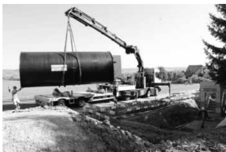
Abb 4: das 4.5 Tonnen schwere Pumpwerk wird abgeladen [neuer Anzeiger]

Im Herbst konnte das neue Quellwasserpumpwerk in Betrieb genommen werden. Das Pumpwerk wurde notwendig, da das Wasser der Quellen Heiligschlecht, die auf dem Gemeindegebiet von Schönenberg-Kradolf liegen, zum höhergelegenen neuen Reservoir gepumpt werden muss. Bisher floss das Quellwasser im Freispiegelabfluss ohne Pumpenbetrieb in das alte Reservoir. Da das Quellwasser als zweites Standbein zum Grundwasser aus dem Thurgebiet heute noch wertvoll ist, wurde das Quellwasserpumpwerk erbaut und mit einer Pumpleitung zum neuen Reservoir ausgerüstet. Im Pumpwerk findet die Aufarbeitung des Quellwassers mit einer UV-Anlage und Trübungsbemessung mit Verwurf zu gesichertem Trinkwasser statt. So können die Quellen heute noch ca. 15% des Trinkwassers liefern.