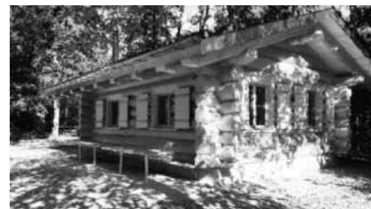
Abb 1: Weiherhütte Istighofen

auch weiterhin der Öffentlichkeit zur Verfügung gestellt wird. Die Bedingungen sind in der Benützungsvorschrift geregelt und können auf dem Internet heruntergeladen werden.