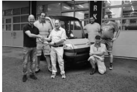
Abb 5: Übergabe des Elektrofahrzeugs

Mitte August konnte dem Werkhof ein neues Fahrzeug für die Kübeltour übergeben werden.