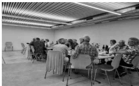
Abb 7: Pensioniertenfeier im Werkhof

Endlich die Lizenz zum Faulenzen und Zeitverschwenden. Der Ruhestand, welcher sich anfühlt wie ein Dauerwochenende – einfach ohne Sonntag-Abend-Blues und die Sorgen, ob der Kaffee im Pausenraum alle ist. Mit diesen Worten durften 43 neu- oder demnächst Pensionierte zur traditionellen Pensioniertenfeier im Werkhof in Bürglen begrüsst werden.