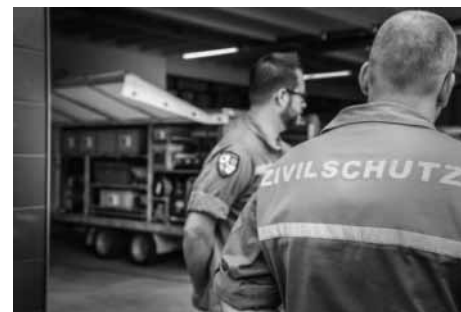
Abb 8: Zivilschutz

Seit meinem Amtsantritt als Mitglied der Zivilschutzkommission im Juni 2023 haben wir uns intensiv mit verschiedenen Aspekten des Zivilschutzes und der Sicherheit in unserem Bezirk beschäftigt. Das Jahr 2023 verlief vergleichsweise ruhig, da keine ernsthaften Einsätze durch die Zivilschutzorganisation erforderlich waren.