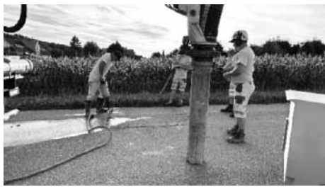
Abb 3: Wasserrohrbruch an der Bettenstrasse