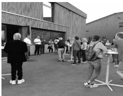
Abb 10: Neuzuzüger Apéro

Auf Anregung verschiedener Vereine wurde dieses Jahr zum ersten Mal ein Neuzuzüger Apéro durch die Gemeinde ausgerichtet. Nach einer Schlossführung trafen sich die neuen Einwohner der Gemeinde auf dem Platz hinter dem Werkhof. Die Vereine der Gemeinde konnten sich den Versammelten präsentieren und es entwickelten sich viele interessante Gespräche.