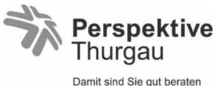
Abb 11: Logo Perspektive Thurgau

Die Perspektive Thurgau ist eine Non-Profit-Organisation und bietet Beratungen in den Bereichen Mütter- und Väterberatung, Paar-, Familien- und Jugendberatung sowie Suchtberatung, Gesundheitsförderung und Prävention an. Trotz höherer Einwohnerzahl gegenüber 2022 nutzten aus der Politischen Gemeinde Bürglen noch 321 Personen für verschiedene Bereiche die Beratungsangebote, gegenüber 339 Personen im Jahr 2022. Bei der Mütter- und Väterberatung waren die Top-Themen die Kindes-Entwicklung, Ernährung und Psychosoziales. Bei der Paar-, Familien- und Jugendberatung waren Partnerschaftsprobleme, psychische Probleme und Entwicklung die Hauptgründe für eine Kontaktaufnahme.