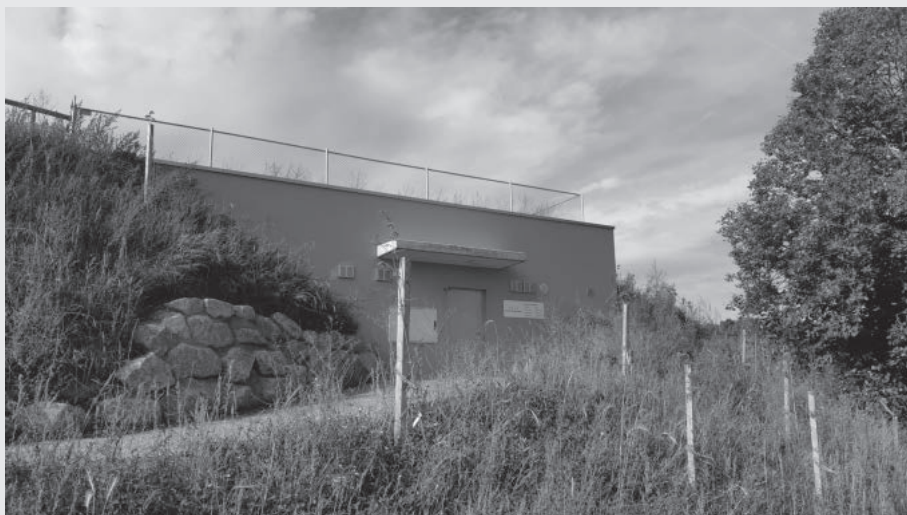
Neues Reservoir Wertbühl