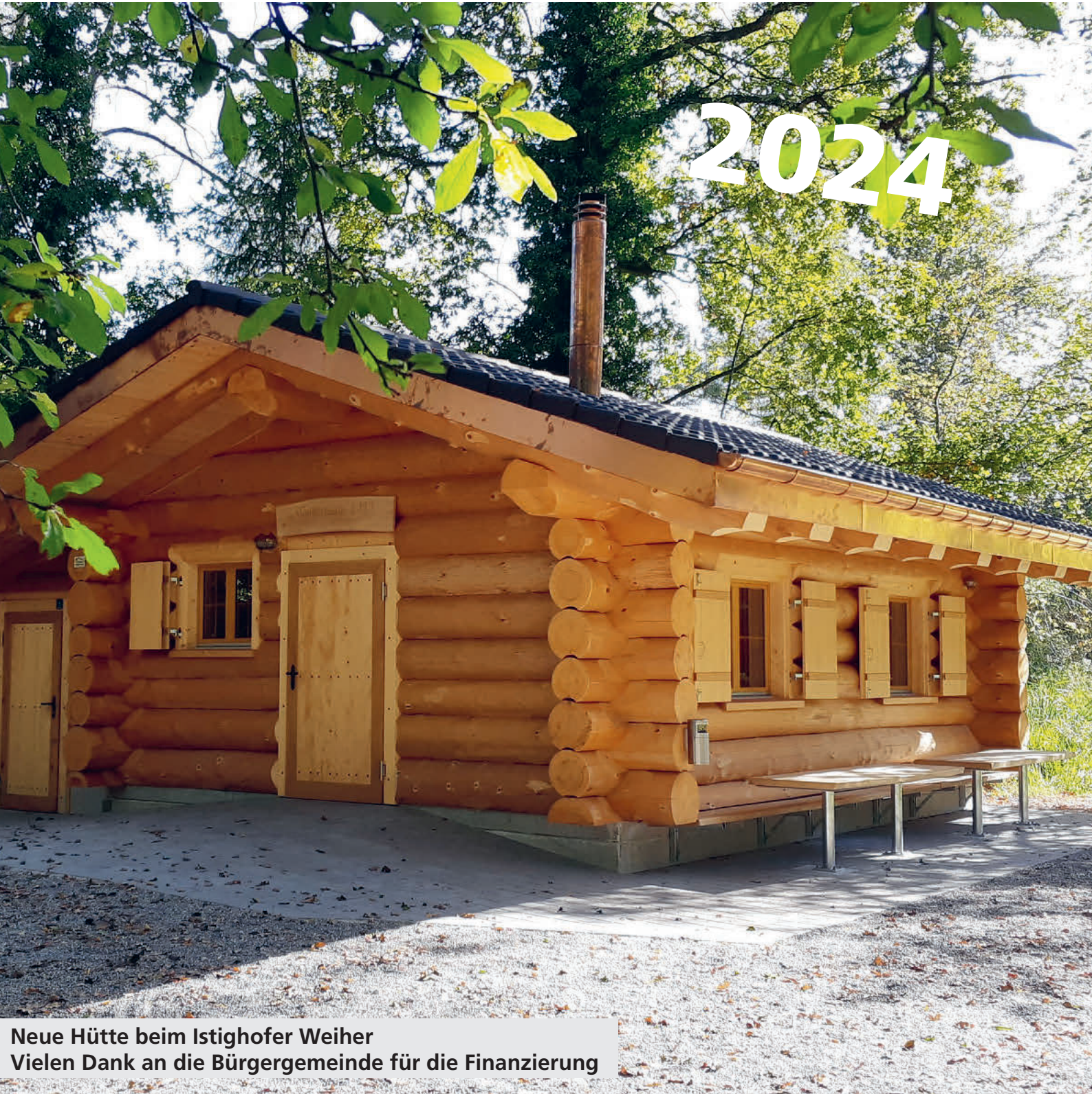
Neue Hütte beim Istighofer Weiher Vielen Dank an die Bürgergemeinde für die Finanzierung

Einladung zur Gemeindeversammlung vom 04. Dezember 2023 20 Uhr, Mehrzweckhalle Bürglen