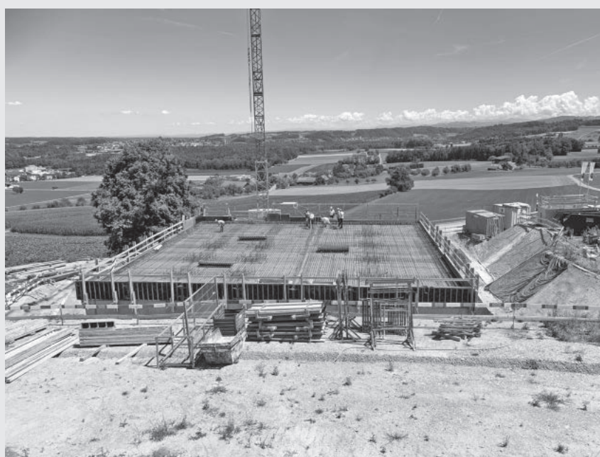
Neubau Reservoir Wertbühl